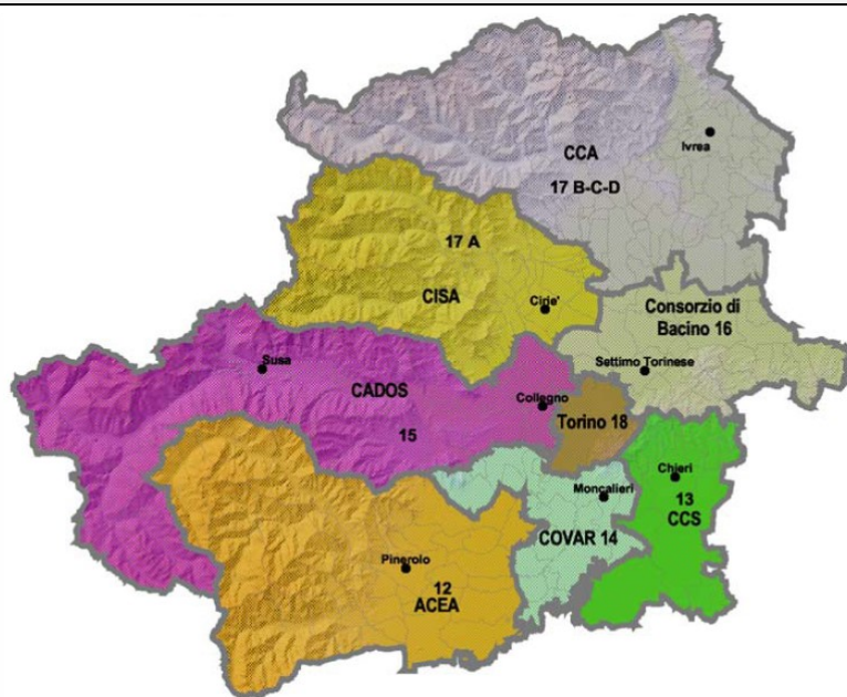
Fig. 3.1 - Rappresentazione territoriale dei Consorzi di Area Vasta della Città Metropolitana di Torino