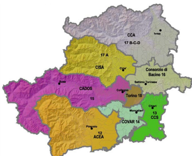
Rappresentazione territoriale dei Consorzi di Area Vasta della Città Metropolitana di Torino

La Conferenza di Ambito di livello regionale costituita in data 4 settembre 2023 (soggetto dotato personalità giuridica di diritto pubblico e di autonomia funzionale, organizzativa, patrimoniale, finanziaria, contabile e tecnica per le attività connesse alle proprie funzioni), composta dai Consorzi di Area Vasta, dalla Città di Torino, dalla Città Metropolitana di Torino e dalle altre province piemontesi, non appena operativa, eserciterà fra le altre, le seguenti funzioni (art. 10 L.R. 1/18):